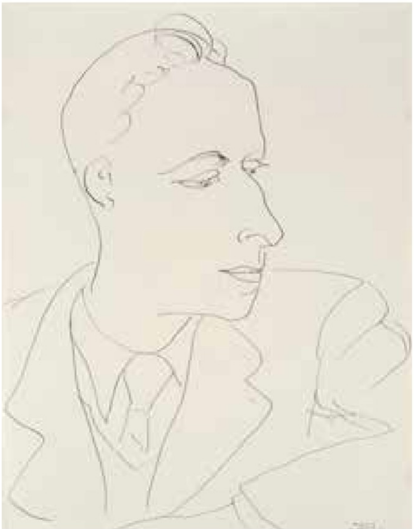
▲ Louis Aragon , mars 1943, encre de Chine sur papier, 53 x 40,5 cm, Collection particulière