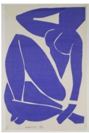
Henri Matisse, Nu bleu III , 1952 Papiers gouachés, découpés et collés sur papier marouflé sur toile, 112 x 73,5 cm, Centre Pompidou, Paris