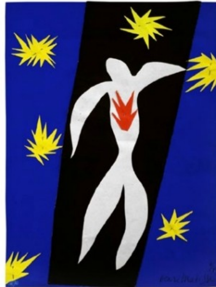
Henri Matisse, La Chute d'Icare , 1943, Papiers gouachés, découpés et épinglés, 36 X 26.5cm Collection privée, courtesy Galerie de l'institut

Prêt exceptionnel d'un collectionneur particulier