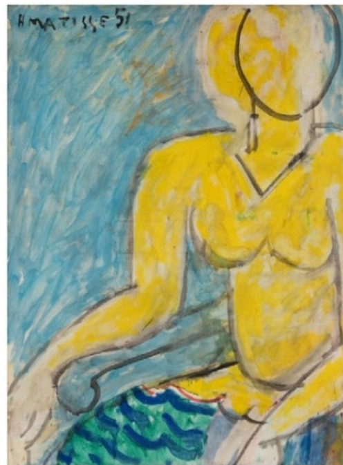
Henri Matisse, Katia à la chemise jaune , 1951, huile sur toile, 82,5 × 61 cm, Musée des Beaux-Arts, Lyon

Prêt exceptionnel du Musée des Beaux-Arts de Lyon