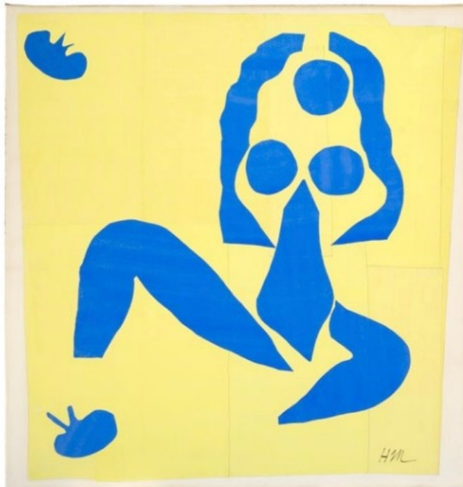
Henri Matisse, Nu bleu, la grenouille, 1952

Enfin Nu bleu, la grenouille , prêt de la Fondation Beyeler n'a pas été exposée en France depuis 1970.