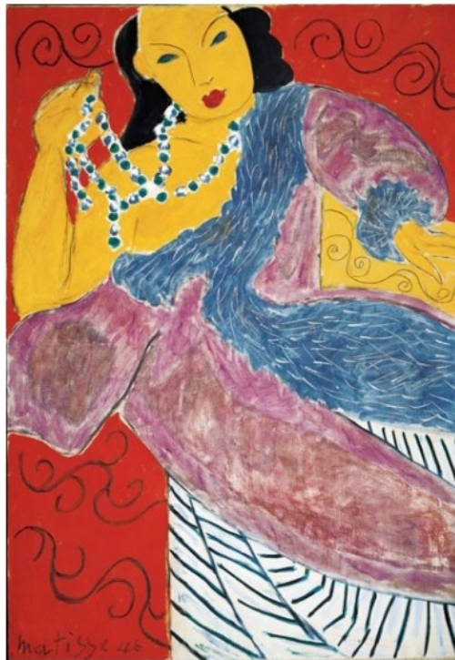
Henri Matisse, L'Asie , 1946, huile sur toile, 116,2 × 81,3 cm, Kimbelle Art Museumn, Fort Worth