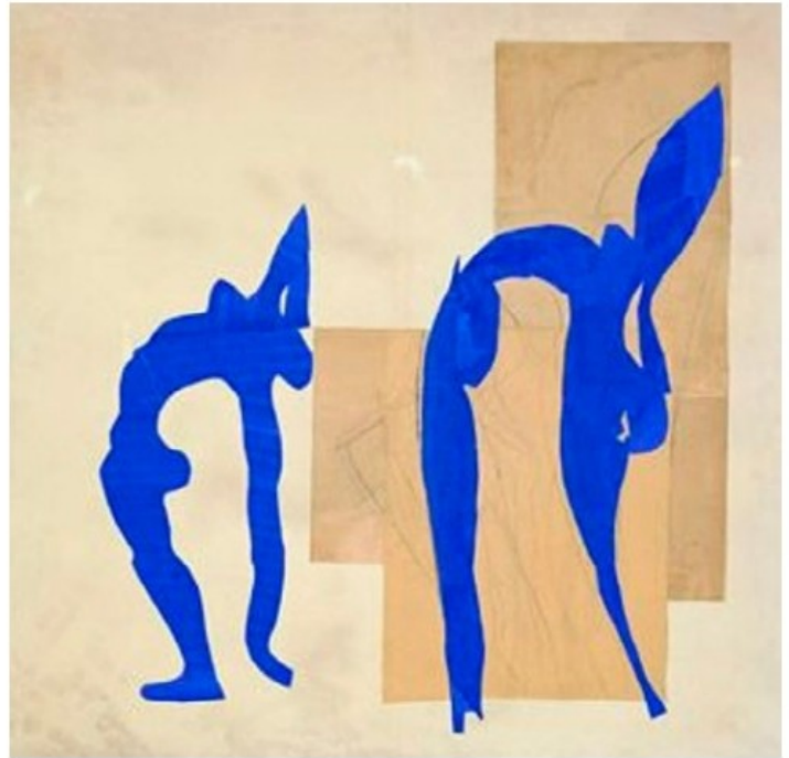
Henri Matisse, Acrobates , 1952, fusain, papiers gouachés, découpés et collés sur papier maroufflé sur toile, 213 x 208,3 cm, coll. part.