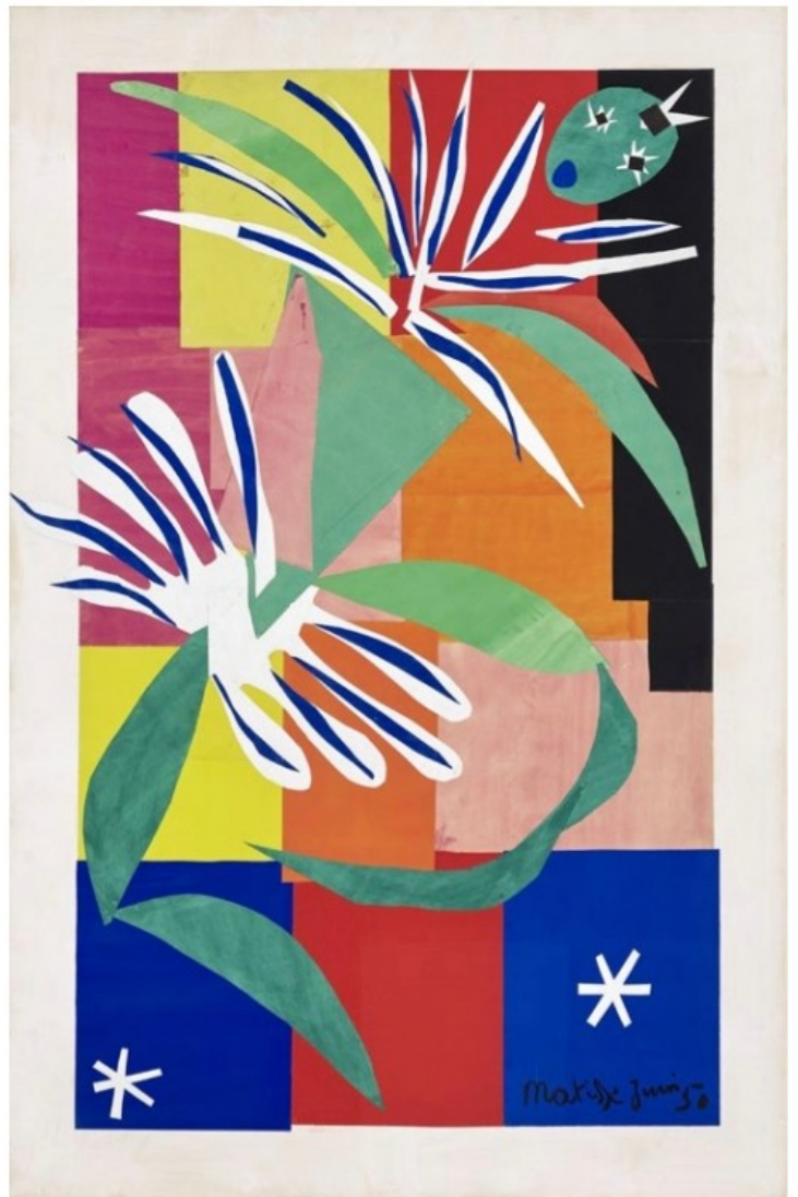
Henri Matisse, Danseuse créole , juin 1950 Papiers gouachés découpés, 205 x 120 cm Musée Matisse Nice. Don d'Henri Matisse, 1953

Enfin les quatre grandes compositions magistrales de 1953, La Gerbe (Hammer Museum, Los Angeles), Les Acanthes (Fondation Beyeler), L'Escargot (Tate, Londres) et Mémoire d'Océanie (MoMA, New York) n'ont jamais encore été réunies et présentées ainsi en France.