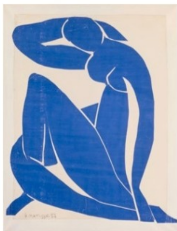
Henri Matisse, Nu bleu II , 1952 Papiers gouachés, découpés et collés sur papier marouflé sur toile, 103,8 x 86 cm, Centre Pompidou, Paris