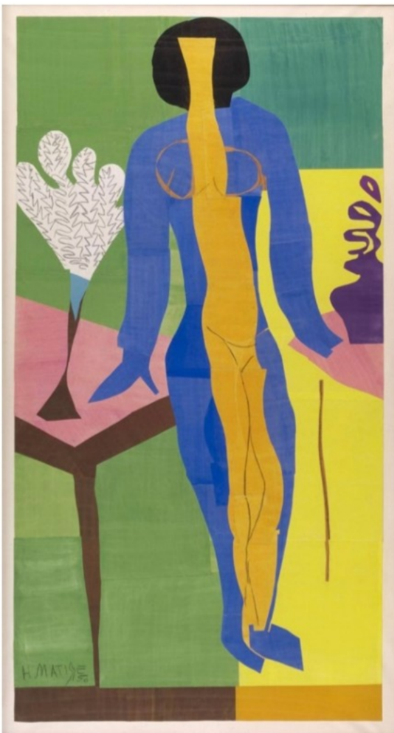
Henri Matisse, Zulma , début 1950 Papiers gouachés découpés, 273 x 152 cm Statens Museum for Kunst, Copenhague

Ce médium particulièrement fragile, car photosensible, n'est désormais que très rarement exposé dans les salles des musées. Les dernières expositions consacrées à la gouache découpée avaient eu lieu à la Tate de Londres et au MoMA à New York, en 2014. C'est la première fois en France, depuis une exposition au Musée des arts décoratifs de Paris en 1961 que le public peut découvrir cette part essentielle de sa pratique qui connaît une postérité importante pour les artistes du 20 e et 21 e siècles.