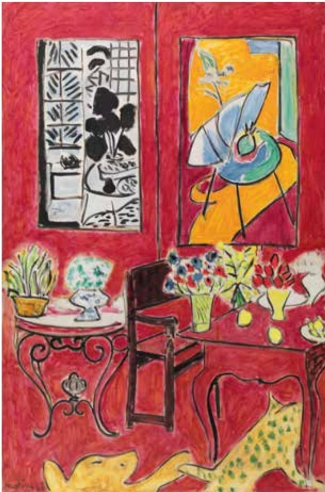
▲ Grand Intérieur rouge , printemps 1948, huile sur toile, 146 x 97 cm, Paris, Centre Pompidou, Musée national d'art moderne