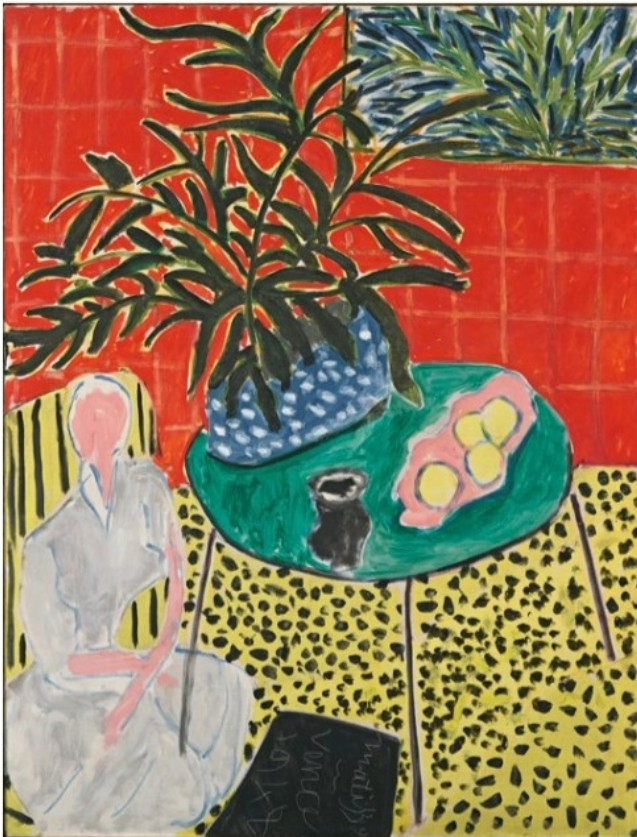
Henri Matisse, Intérieur à la fougère noire , 1948 huile sur toile, 116 x 89,5 cm, Fondation Beyeler, Riehen/Basel