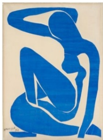
Henri Matisse, Nu bleu I Papiers gouachés, découpés et collés sur papier marouflé sur toile, 106,3 x 78 cm Fondation Beyeler, Riehen