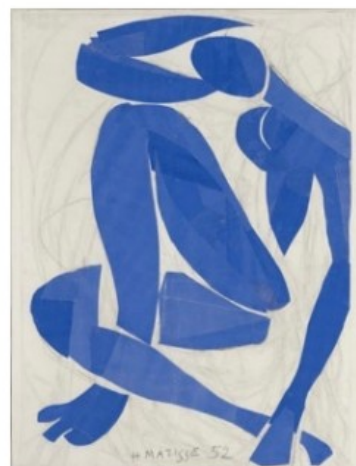
Henri Matisse, Nu bleu IV , 1952 Fusain et papiers gouachés découpés, collés sur papier, marouflé sur toile, 102,9 x 76,8 cm Musée Matisse Nice. Donation Madame Jean Matisse à l'Etat français pour dépôt au Musée Matisse Nice, 1978, Musée d'Orsay, Paris