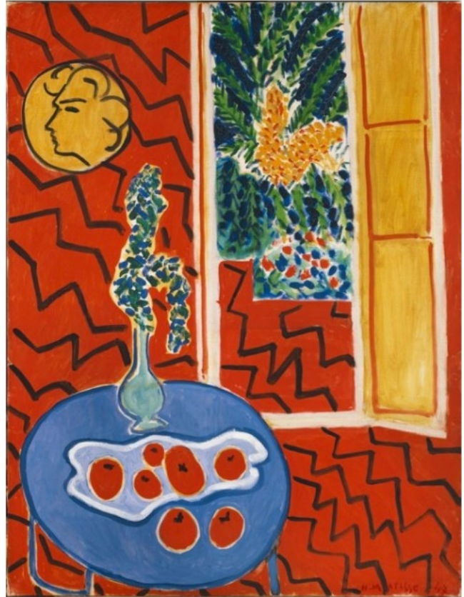
Henri Matisse, Intérieur rouge, nature morte sur table bleue , 1947 Huile sur toile, 116 x 89 cm, Kunstsammlung Nordrhein-Westfalen, Düsseldorf

Onze de ces Intérieurs seront donc rassemblés exceptionnellement à l'occasion de l'exposition.