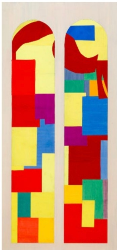
À gauche Henri Matisse, Saint Dominique , 1949 Pinceau et encre de Chine sur papier marouffé sur toile avec corrections de gouache blanche et papiers collés, 310 × 137 cm Musée Matisse Nice Don des héritiers de l'artiste, 1960