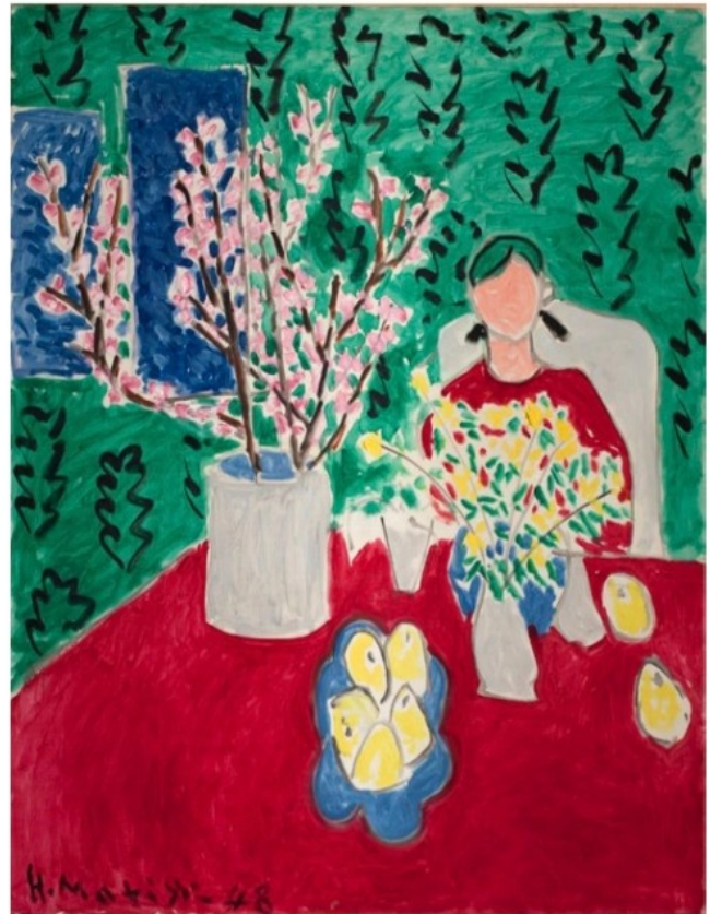
Henri Matisse, Branche de prunier, fond vert , 1948 huile sur toile, 116 x 88,9 cm, Pinacoteca Agnelli, Turin