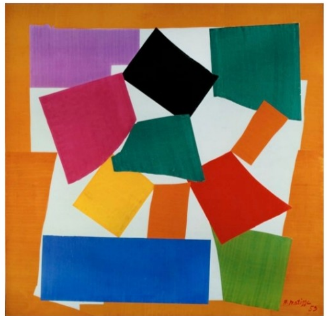
Henri Matisse, L'Escargot , 1953 papiers gouachés, découpés et collés sur papier maroufflé sur toile, 286 x 287 cm, Tate, Londres