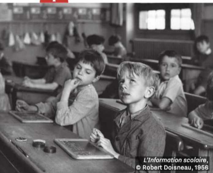
L'Information scolaire, © Robert Doisneau, 1956