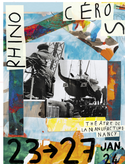
Affiche du Théâtre de la Manufacture