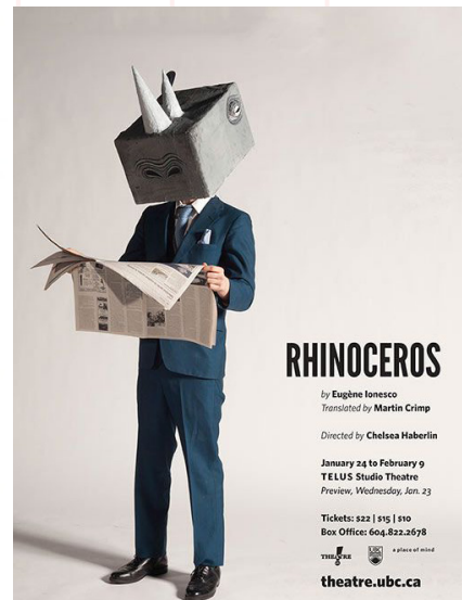
Affiche du Théâtre UBC