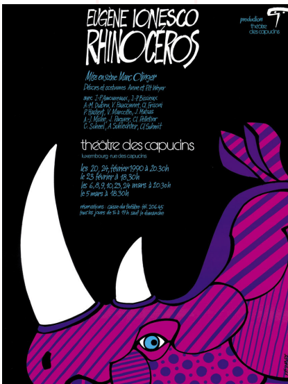
Affiche du Théâtre des Capucins

Prenez en compte toutes les étapes précédentes et justifiez ce choix.