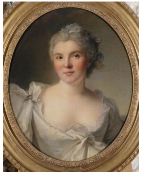
Portrait de femme, J-M Nattier 18ème siècle