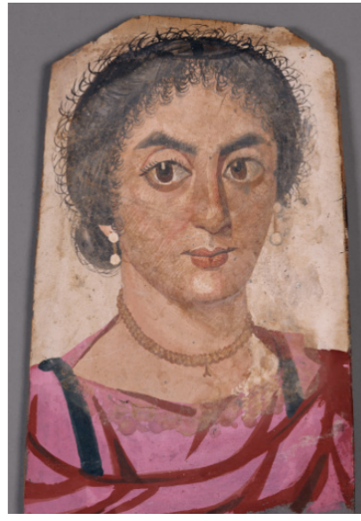
Portrait d'une momie féminine, 200 Avant JC