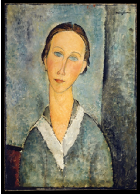
Fille dans une blouse de marin, Modigliani 1918