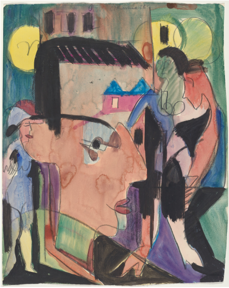
Autoportrait, Ernst Ludwig Kirchner 1928