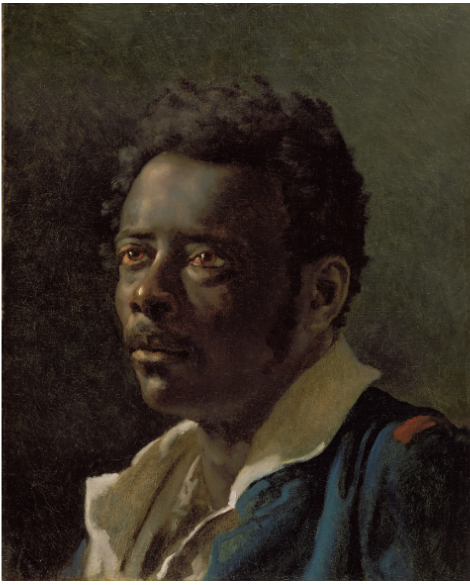
Etude du modèle Joseph, Géricault 1818