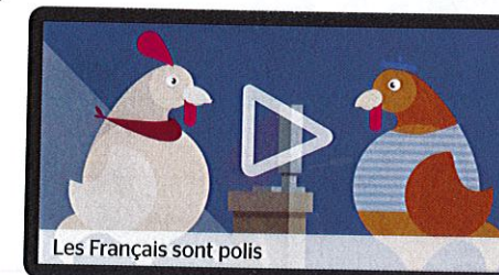
Les Français sont polis

Retrouvez la vidéo et les activités sur espacevirtuel.mdl.fr